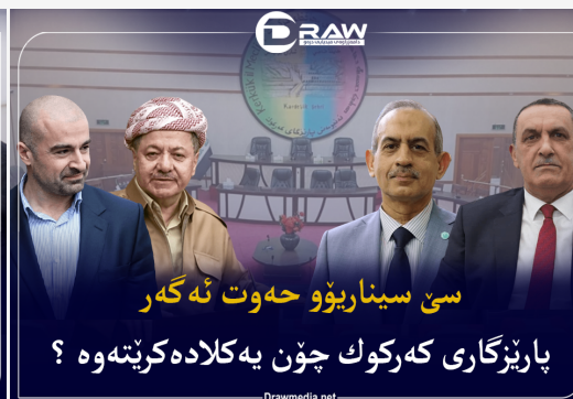
سیناریۆو حه‌وت ئه‌گه‌ر