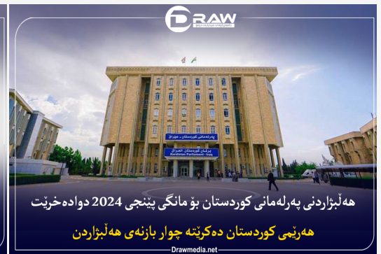
هه‌لبژاردنی په‌رله‌مانی کوردستان بۆ مانگی پینچی 2024 دواده‌خریت