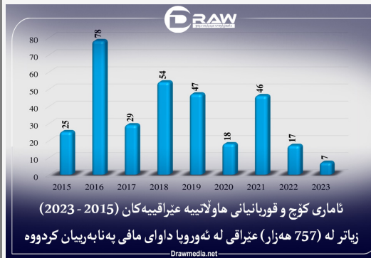
ناماری کۆچ و قوربانیا‌نی هاو‌لاتییه‌ عیراقییه‌کان (2015 - 2023)