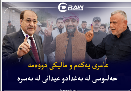
عامری به‌که‌م و مالیکی دوومه‌مه