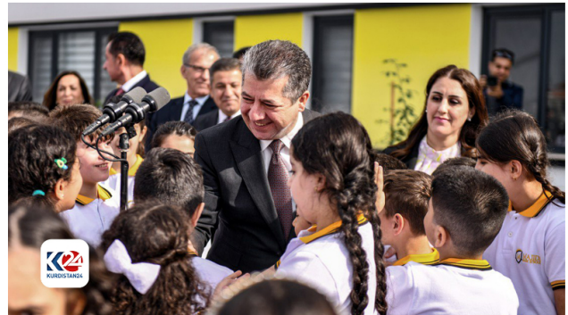
کوردستان | کابینه‌ی نۆبه‌می حکومه‌تی هه‌زیمی کوردستان | سه‌رۆکوه‌زیران مه‌سرور بارزانی | په‌روه‌ده | فوتابیان