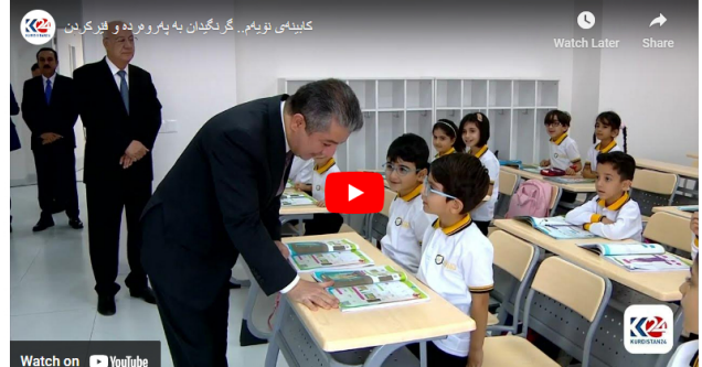
کابینه‌ی نوێمه‌... گرتگرتان په‌ په‌روه‌ده و فیژکردن