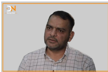
2023/09/15 - 01:07

زىيانى دانبال لە لىببا چ بەيامىكى بۇ كوردستان بېنو؟