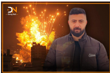
2023/09/09 - 03:44

زىيانى دانبال لە لىببا چ بەيامىكى بۇ كوردستان بېنو؟