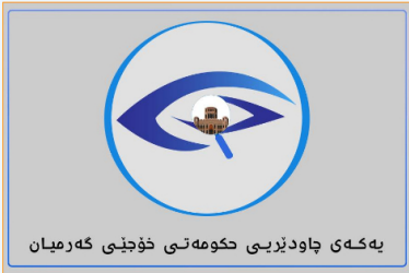
بەكەي چاۋدېزىيى كۆمەتەي خۇجىي گەرميان